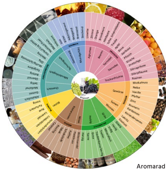
Aromarad für Grappa und Marc.

Das Aromarad Grappa und Marc besteht aus drei konzentrischen Kreisen. Diese sind durch den mittleren Kreis farblich gruppiert, in sieben Wahrnehmungskategorien (fruchtig, würzig, pflanzlich, röstig, blumig, Fehlgerüche und Gaumen) gegliedert. Die Kategorien werden im inneren Kreis in Unterkategorien aufgeteilt. Der äussere Kreis enthält 68 Attribute, die die Beschreibung von Grappa und Marc vereinfachen. Sämtliche Aromaräder können kostenlos über den nebenstehenden