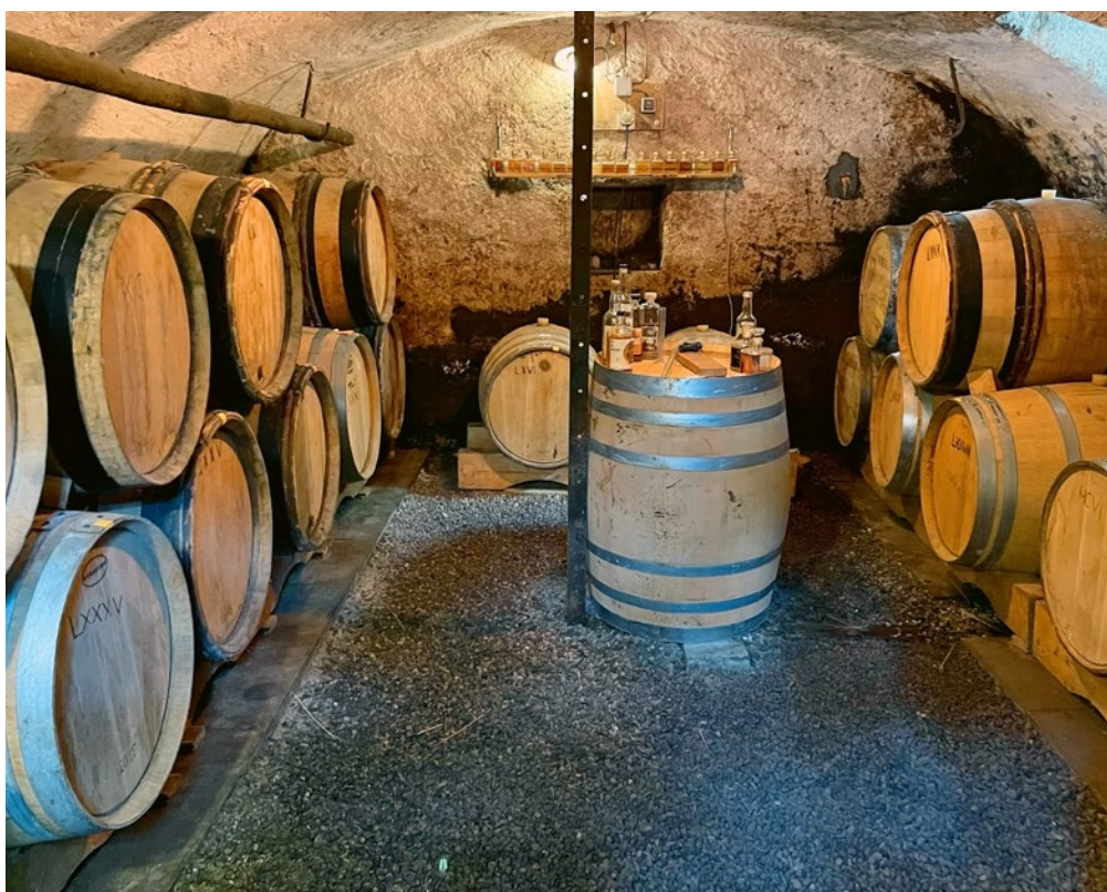
Abb. 2: Der Whiskyfass-Keller.

Die bald zweifache Mutter findet es vorteilhaft, in einem familiären Betrieb zu arbeiten. «Wir können uns gut aufeinander abstimmen, sprechen miteinander, sind flexibel und möchten es in diesem familiären Rahmen