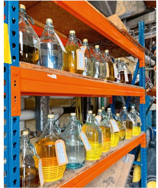
Abb. 3: Es werden auch Kleinmengen im Lohn verarbeitet.

Angesprochen auf die zahlreichen Prämierungen ihrer Produkte stellt sich heraus, dass Schwab Preise und Auszeichnungen als Chance betrachtet, um nicht betriebsblind zu werden. Sie schätzt es, andere Meinungen zu