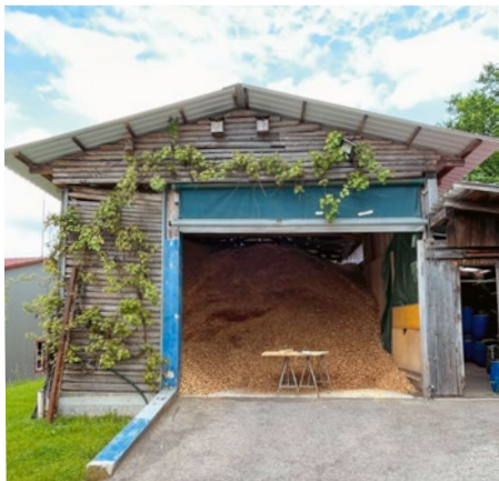
Abb. 1: Seit 2007 wird eine nachhaltige Holzschmelzheizung betrieben.